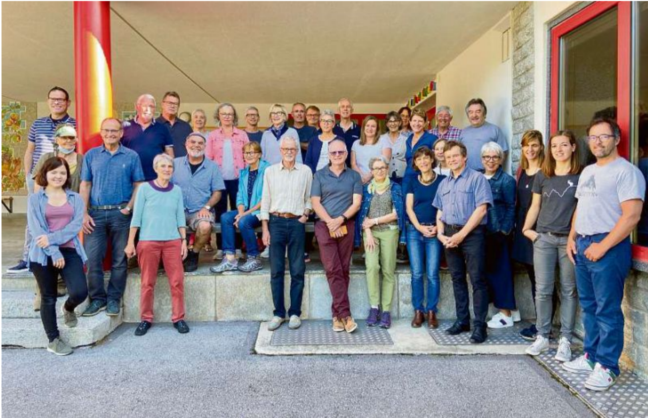
Cun biebin 30 participontas e participonts ei il cuors da romontsch staus in grond success.